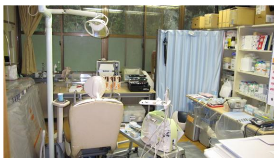
〈セッティング後のセンター内処置室〉

初日は、大里地区に着いた夕方から、早速、前日から治療を楽しみに待っておられた患者さんの処置を見学しました。今回の巡回歯科診療隊は3泊して黒島を出発する計画でした。歯科治療後の経過を継続して診ることができないため、治療をどこまで行えば良いかなど治療計画立案の難しさを感じました。そういった条件の、限られた時間の中でも先生は、患者さんの相談に耳をじっくり傾けて、丁寧な治療をされていました。これまで歯科治療の予約や、リコール、数回に分けた治療計画の立案を当然のこととして考えていましたが、すぐに往診に来ることができない離島巡回診療では、その特殊性を考慮しながら進めなければいけないことを改めて認識しながら、離島実習を過ごしました。